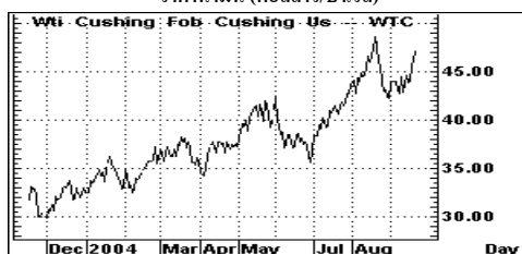
ราคาน้ำมัน (ดอลลาร์/บาร์เรล)