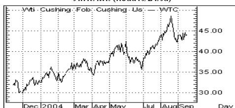
ราคาน้ำมัน (ดอลลาร์/บาร์เรล)