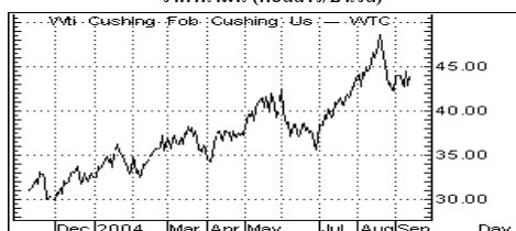
ราคาน้ำมัน (ดอลลาร์/บาร์เรล)