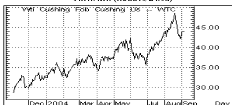
ราคาน้ำมัน (ดอลลาร์/บาร์เรล)