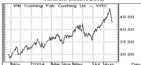
ราคาน้ำมัน (ดอลลาร์/บาร์เรล)