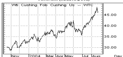
ราคาน้ำมัน (ดอลลาร์/บาร์เรล)