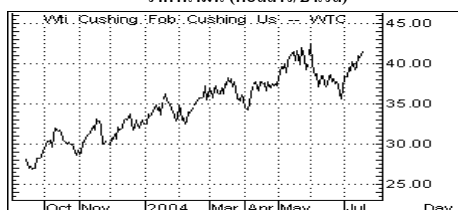
ราคาน้ำมัน (ดอลลาร์/บาร์เรล)