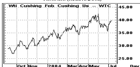
ราคาน้ำมัน (ดอลลาร์/บาร์เรล)