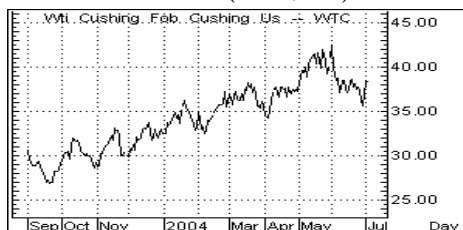
ราคาน้ำมัน (ดอลลาร์/บาร์เรล)